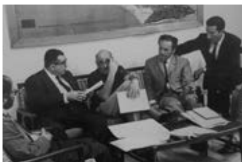
Allen Ginsberg, José Lezama Lima, J.M. Cohen, Nicanor Parra y Jaime Sabines, jurados de Poesía en 1965.

E n tiempo de fundaciones y delirios, el certamen convoca a lo mejor de la intelectualidad latinoamericana, caribeña y de otras regiones que viajan en masa a La Habana, y convierten tanto al Premio como a la Casa misma –sobre todo gracias a su revista y editorial–, en eje del movimiento literario que se estaba gestando. Para decirlo pronto y mal, y ateniéndonos a uno solo de sus géneros, sin el Premio, es decir, sin la Casa, o sea, sin la Revolución cubana, no se hubiera producido –al menos, no del modo y el alcance que le conocemos– esa eclosión de la novelística latinoamericana que luego sería reducida al mercadotécnico nombre de boom.