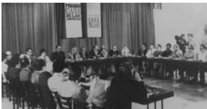
Inauguración de la edición 25 del Premio, en 1984.

Si de algo han pecado el Premio Literario y la institución que lo sostiene es de ambición. Ninguno de los dos se subordinó nunca a la lógica de las inevitables limitaciones con las que les tocó bregar. Aspiraron siempre a más, a crecer, a entregar nuevos galardones, a involucrar a los jóvenes nacidos literariamente cuando ambos ya estaban consolidados, a vivir orgullosos de su pasado sin dejarse derrotar por los fantasmas de la nostalgia, a sobrevivir a sus propios traspies, a arriesgar. Tal vez si se hubieran sometido a la cordura, habrían sido condenados a la desaparición o, peor aún, a la irrelevancia. Por fortuna la historia fue otra.