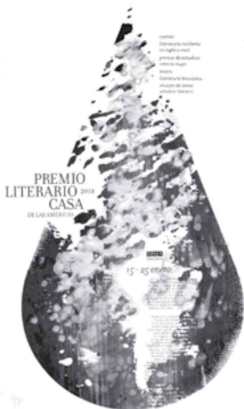
Cartel del Premio de 2018.

T ras llegar a este punto es inevitable hacer balance de lo alcanzado, de lo no logrado, e imaginar lo por venir. En 1999, al cumplir el Premio cuatro décadas de vida, se preguntaba Roberto Fernández Retamar en las palabras de inauguración del certamen: «¿qué van a hacer los jóvenes con el Premio Casa de las Américas? ¿Quedará como está? ¿Desaparecerá, entendiéndose que su misión ha sido cumplida? ¿Encontrará maneras creadoras de seguir prestando servicios? [...] quiero dejar las preguntas en el aire, con la certidumbre de que serán bien respondidas. Si hemos sabido ser los mismos y otros; si hemos vivido y sobrevivido a través de pruebas a menudo bien complejas, tropezando y volviendo a encontrar el paso, tenemos derecho a la confianza. Tenemos más, el derecho, y probablemente el deber, de volver a empezar».