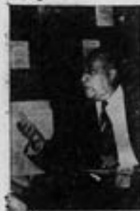
Miguel Ángel Asturias habla para los trabajadores sobre los problemas sociales de América.

Martes 9 a las 8 p.m. en el teatro de la C.T.C.