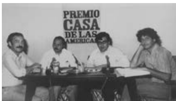
Juan Gelman, Fayad Jamís, José Emilio Pacheco y Antonio Cisneros en 1981.

Si de algo han pecado el Premio Literario y la institución que lo sostiene es de ambición. Ninguno de los dos se subordinó nunca a la lógica de las inevitables limitaciones con las que les tocó bregar. Aspiraron siempre a más, a crecer, a entregar nuevos galardones, a involucrar a los jóvenes nacidos literariamente cuando ambos ya estaban consolidados, a vivir orgullosos de su pasado sin dejarse derrotar por los fantasmas de la nostalgia, a sobrevivir a sus propios traspies, a arriesgar. Tal vez si se hubieran sometido a la cordura, habrían sido condenados a la desaparición o, peor aún, a la irrelevancia. Por fortuna la historia fue otra.